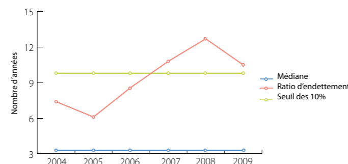
Nombre d'années de CAF brute nécessaire au remboursement de la dette

Pour pouvoir investir et préparer l'avenir, il faut réduire la dette de la commune. Ce graphique représente le nombre d'années de capacité d'autofinancement brute nécessaire au remboursement de la dette.