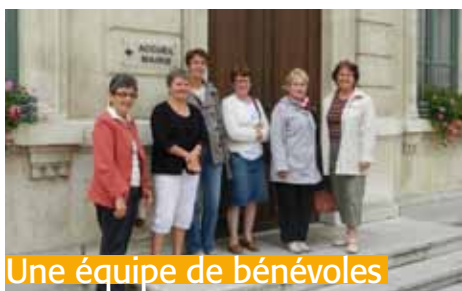
Une équipe de bénévoles