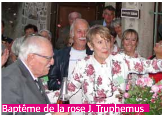
Baptême de la rose J. Truphemus