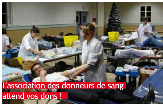
L'association des donneurs de sang attend vos dons !