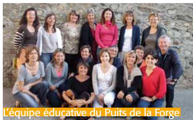
L'équipe éducative du Puits de la Forge