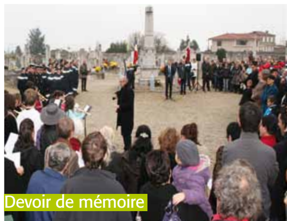
Devoir de mémoire

mémoration de l'armistice du 11 novembre 1918 qui avait généré à l'époque des effusions de joie dans le monde entier. La cérémonie se déroulera le vendredi 11 novembre à 10h30 au cimetière.