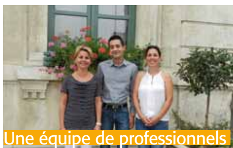
Une équipe de professionnels

Dans ses missions, le CCAS est assisté de bénévoles motivés qui interviennent dans le cadre de l'aide aux devoirs ou d'actions auprès des personnes âgées. Mobilisés ils donnent de leur temps pour développer des actions qui sans leur aide ne pourraient voir le jour. Merci à eux.