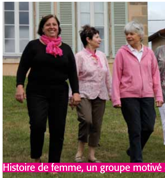
Histoire de femme, un groupe motivé

> plus de renseignements : Rendez-vous p.22 de votre magazine